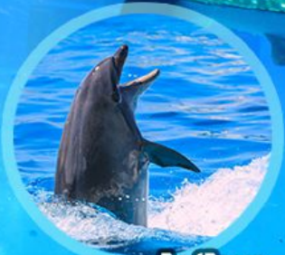
ชมโชว์โลมา