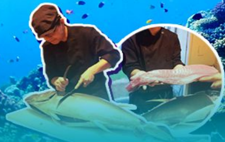
พิเศษ!! ซาบู ซาบู สไตล์ญี่ปุ่น

บุฟเฟต์คินยามากิพร้อมชิมปลาภูเขาโดยเชฟมาเสิร์ฟกินแบบสดๆ!!