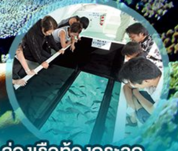
ส่องเรือท่องกระจก

ส่องเรือกระจก ชมประภาคารใต้ท้องทะเลสุดงดงาม