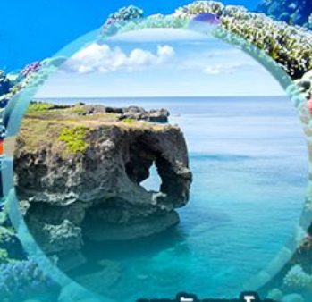
ผามินซาโมะ

บุฟเฟต์คินยามากิพร้อมชิมปลาภูเขาโดยเชฟมาเสิร์ฟกินแบบสดๆ!!